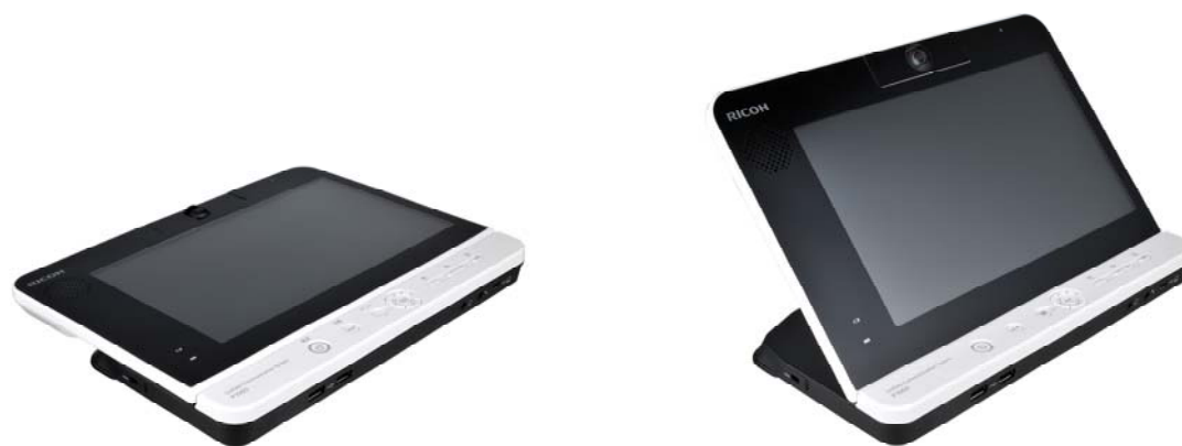
RICOH Unified Communication System P1000