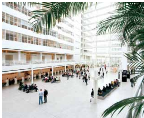
リコー製品が導入された市政府庁舎の窓口

欧州の販売会社リコーネザerland（RNL）では、TGOSに基づいたオフィス機器の使用状況のアクセスメント、提案、導入、レポートといった一連の流れによる販売活動がお客様に受け入れられています。2007年度から2009年度にかけて、RNLは、オランダのある市政府の14部門（職員約8,000名）を対象とするオフィス機器更新の入札に参加しました。同市は2010年にカーボンニュートラルを達成することを目標に掲げており、選考にあたっては、「サプライヤーが持つ持続可能性のビジョン」を含む「品質」についての評価が全体の40%と、「価格」（35%）や「アフターサービス」（15%）以上に大きなウエイトを占めていました。6社による競争入札の結果、機器置き換えによる業務効率化やコスト削減提案だけでなく、リコー製品の使用によるTCOとCO 2 の削減等を含むお客様のプリンティング環境の改善をコンサルティング報告として提案したRNLが落札しました。この結果、これまで多種類の機器が混在し、部門ごとに管理されていましたが、これらが集約されました。また@Remoteを用いた機器の一元管理により管理業務とコスト削減が実現し、市政府の業務改善に貢献することができました。