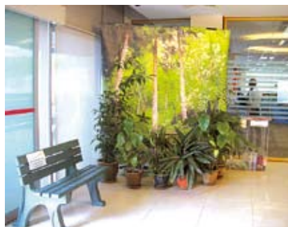
RMSオフィスのグリーンバランスコーナー

販売会社リコーマレーシア (RMS) では、お客様のオフィスの環境コーナーづくりや環境活動への支援を行っています。RMSのオフィスでは、トナーカートリッジをリサイクルして製作したベンチとその再生プロセスの紹介、地域の