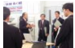
見学のお客様へのご説明