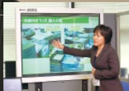
ライブオフィスを説明するアテンダント

てきました。しかし、単に紙文書の電子化機能をもつ機器を導入しただけでは、効果的な削減にはつながりません。そこで、“お客様にご提案する前にまず自ら実践”という考えのもと、ペーパーレス化をはじめ環境視点でのオフィス改善に実際に取り組み、自らのオフィスを公開して、そのノウハウごとお客様に提案する試みが始まりました。関東地区の販売を統括するリコー販売(株)では、2002年度に社内プロジェクトチームを発足。まず、デスクやキャビネット