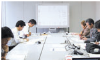
支援先のNPOを決める選考会議

た支援金をNPOに助成する仕組みです。支援先は、中部地域で環境活動を行うNPOから公募し、お客様と社員の投票を経て、NPO・行政・教育機関などの関係者、地域貢献に取り組む他企業の担当者を変えた選考会によって決定されます。選考基準の中に「リコーグループ社員の参加が期待できること」を入れていることも特徴のひとつです。