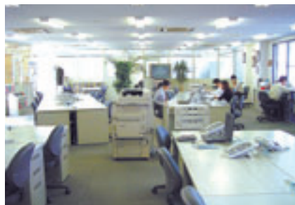
三重リコー津事業所のペーパーレスオフィス

* http://www.eco.pref.mie.jp/news/interview/index.htm (企業・法人が語る:2003年4月9日)