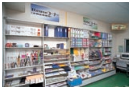
グリーン商品コーナー(リコーユニテック)

リコーの首都圏8事業所、および生産系3事業所では、社内で使用するOA機器、備品、文具、販促品、贈答品などに関する「グリーン購入リスト」を作成するとともに、自動発注システムを構築し、効率的なグリーン購入を推進。このシステムの全国展開を図っています。また、リコーユニテックでは、事務用品の「グリーン商品コーナー」を設置。仕入先様とオンラインで結ばれ、在庫が少なくなると自動的に供給されるだけでなく、紙の発注伝票も不要になっています。