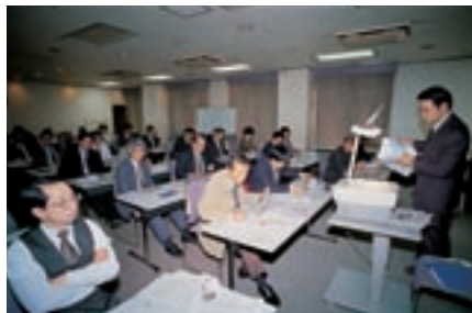
2001年2月に開催された「第5回グリーン調達 仕入先様 技術交流会」