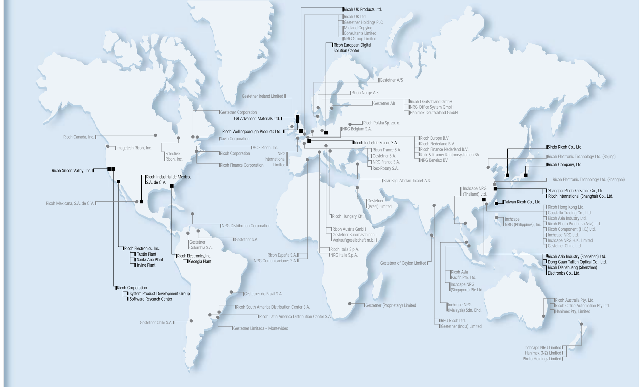
リコーグループの事業別売上高