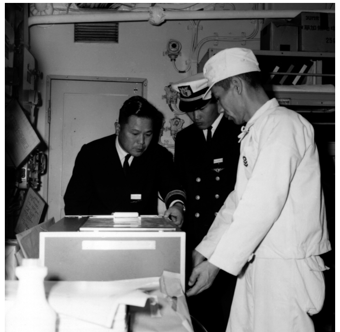
南極観測船「ふじ」で活躍する電子リコピー BS-1 (1966年)