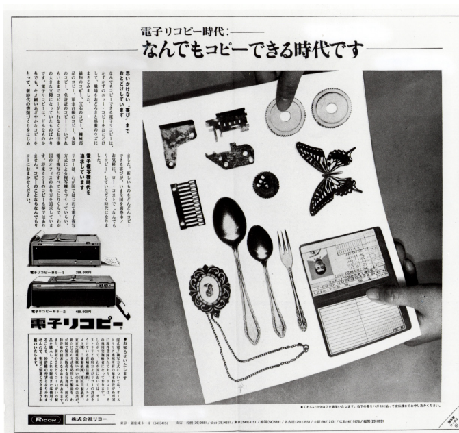
当時の電子リコピーのキャンペーン広告 (1965年)